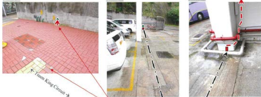
G/F - Car Park

Existing WTT joint box with underground pipe